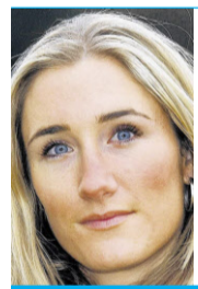
Tanja Frieden Snowboard-Olympiasiegerin 2006, Schweizer Sportlerin und Thunerin des Jahres 2006.